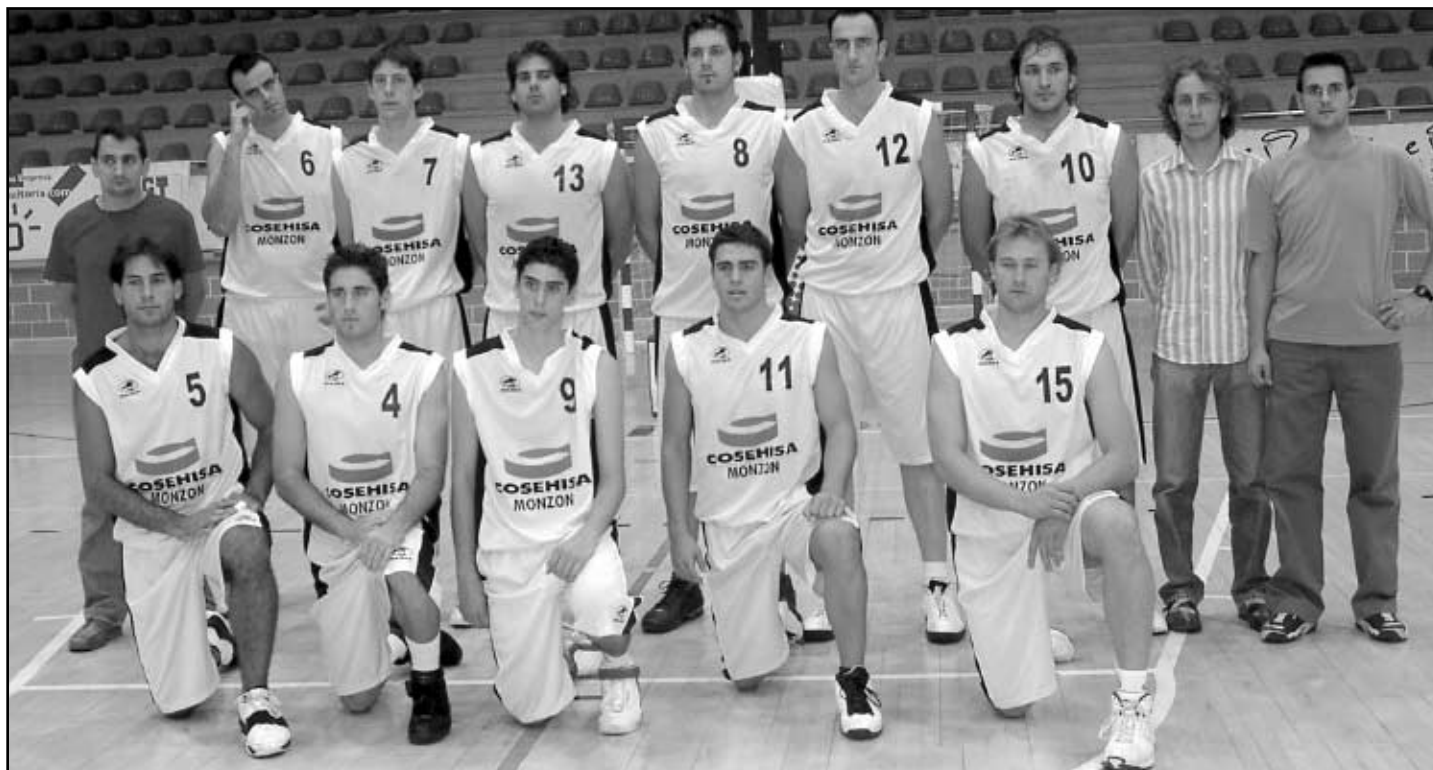
Plantilla del Cosehisa-Monzón