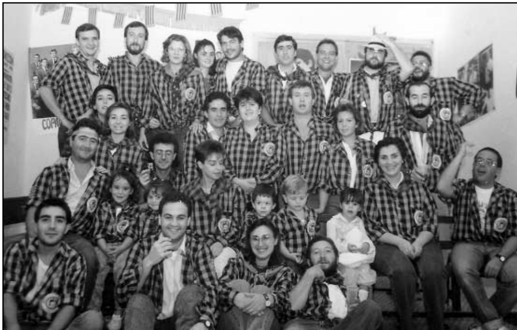
Foto de familia en el San Mateo de 1989.